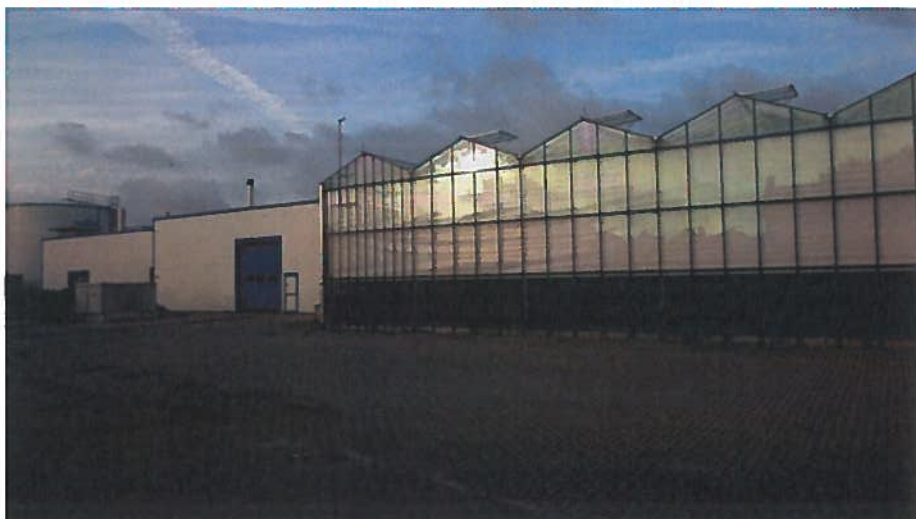
Kassen bij Sexbierum. Om lichtuitstraling 's nachts tegen te gaan worden de kassen aan de zijkant afgeschermd. Als totaal vallen de kassen vanaf de waddendijk gezien niet op.

Enkele gemeenten zijn actief bezig met het behoud van de landschappelijke kwaliteiten van Waddenzee, bijvoorbeeld voor wat betreft de duisternis. Zo is in Franekeradeel in een strook langs de Waddenzee de straatverlichting achterwege gelaten en worden kassen aan de zijkant afgeschermd. Verdere uitbreiding van de glastuinbouw is voorzien, waarbij afspraken zijn gemaakt over beperking van de lichtuitstraling. Texel wil reguliere verlichting vervangen door dimbare led-lampen.