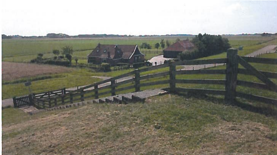
Het Friese waddegebied bij Ferwerd. Er vinden hier nauwelijks ontwikkelingen plaats.

Enkele gemeenten zijn actief bezig met het behoud van de landschappelijke kwaliteiten van Waddenzee, bijvoorbeeld voor wat betreft de duisternis. Zo is in Franekeradeel in een strook langs de Waddenzee de straatverlichting achterwege gelaten en worden kassen aan de zijkant afgeschermd. Verdere uitbreiding van de glastuinbouw is voorzien, waarbij afspraken zijn gemaakt over beperking van de lichtuitstraling. Texel wil reguliere verlichting vervangen door dimbare led-lampen.