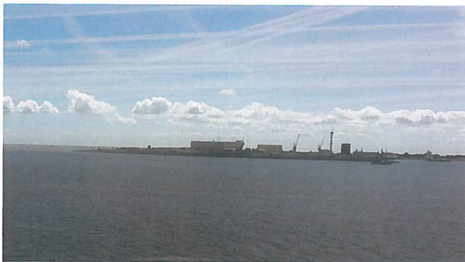
De haven van Den Helder vanaf de Waddenzee. Het Dok (45m hoog) is door de gemeente als referentiepunt genomen voor de stedenbouwkundige invulling elders in de stad.

In de havensteden is hoogbouw gepleegd, zowel in de havens zelf als in het aansluitend stedelijk gebied, waarbij aansluiting is gezocht bij aanwezige bouwhoogtes in de havens. Ook hebben uitbreidingen plaatsgevonden in de havens zelf, die zichtbaar zijn vanaf de Waddenzee. Voor zover de bebouwingshoogtes aansluiten bij de verticale bebouwingscontour is het conform de regels die het Barro stelt aan bestemmingsplannen (artikel 2.5.12 bebouwing in het waddengebied). Het Barro schrijft alleen voor dat bij de voorbereiding van het bestemmingsplan een passende beoordeling heeft plaatsgevonden. In het kader van het onderzoek is niet meegenomen of dat heeft plaatsgevonden.