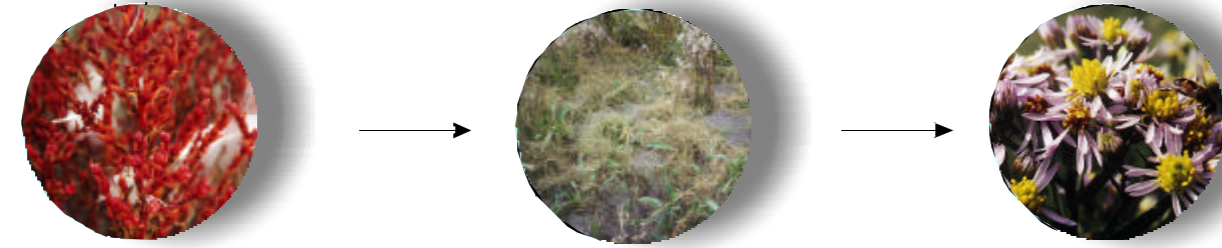
Zeekraal Gewoonkweldergras Zeeaster

0 500 1000 1500 2000 2500 m op basis van falsecolor-luchtfoto's