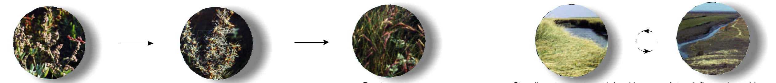
Gewone zoutmelde Zeealsem Roodzwenkgras Strandwee op de beweidewelder Intensiefbeweidewelder