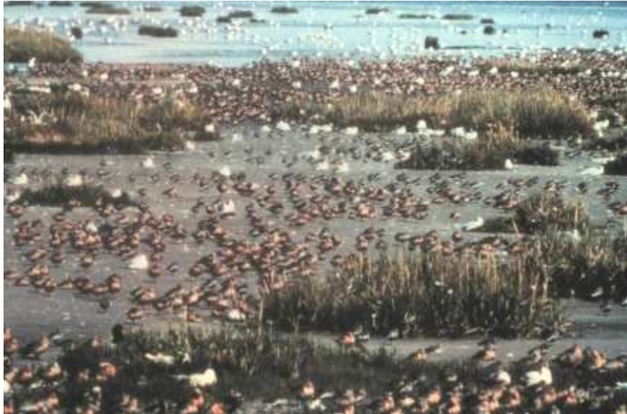
Hoogwatervluchtplaats in de lage kwelder