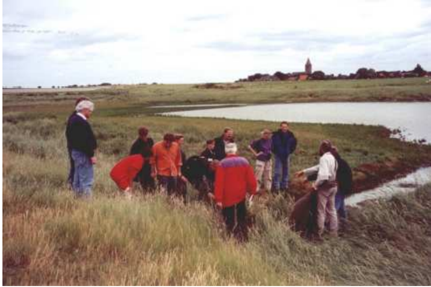
Excursie in het natuurgebied Vatrop nabij het dorpje Oosterland op Wieringen