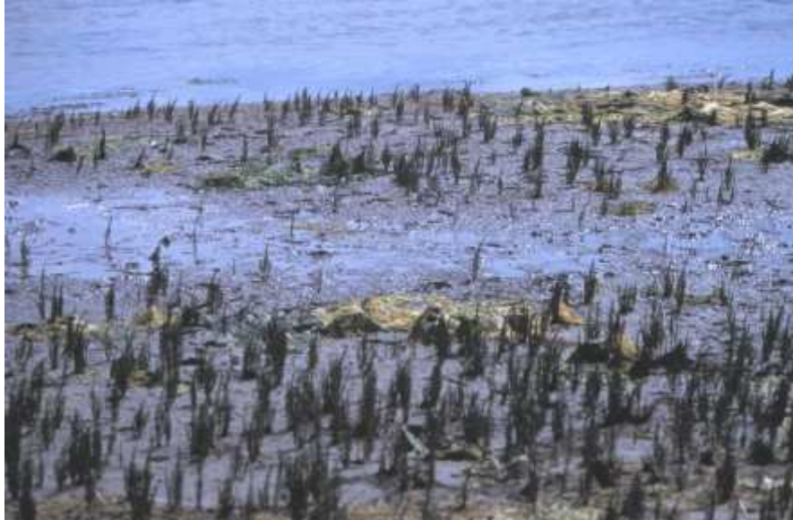
Pionierzone met Zeekraal