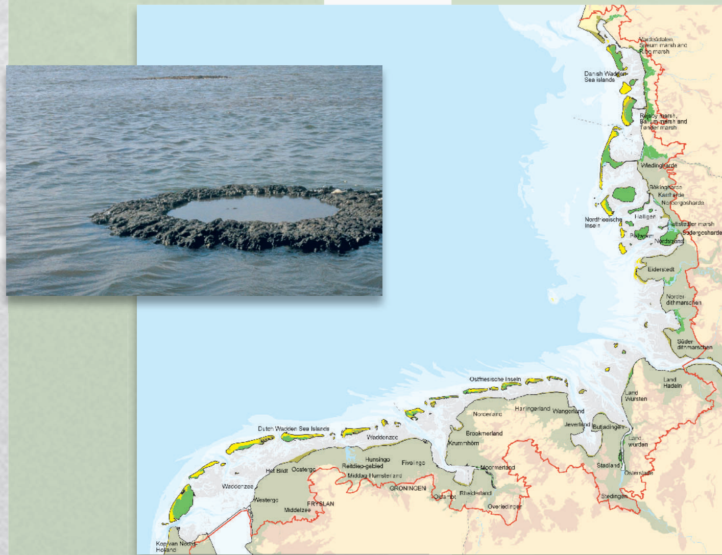
Misthusum Enge (DK)

De 'Wash Estuary Strategy Group' heeft recent een hernieuwd plan vastgesteld voor een duurzaam beheer van natuur en landschap van het Wash regio. Om kennis hierover uit te wisselen, met name over de wijze van waardering, is The Wash uitgenodigd om te participeren in LancewadPlan.