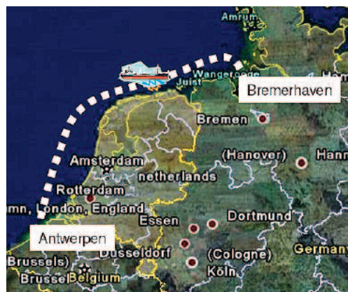
Motorschip Tenidna verliest boven Ameland en Schiermonnikoog drie tanktainers met tien ton chloorwaterstof

worden. De veerdiensten vervullen daarbij een belangrijke rol. Door de noordwesterstorm en het daarmee gepaard gaande hoogwater, kunnen de veerdiensten echter niet direct aanleggen. ■