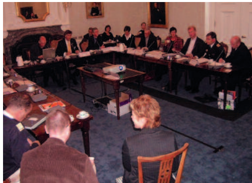
Het Beleidsteam Waddenzee loopt tijdens de eerste bijeenkomst tegen diverse dilemma's aan

De operationeel leider brengt in het BTW verslag uit. Uit een eerste verkenning blijkt dat er op dit moment nog geen lekkage is van de tanktainers, maar dat het risico groot is dat dit wel gaat gebeuren. Verder zijn hulpverleners bezig om het gevaar zoveel mogelijk in te perken en zijn de sirenes afgegaan. De eilandbewoners houden zich echter maar gedeeltelijk aan de oproep om ramen en deuren te sluiten en binnen te blijven. >>>